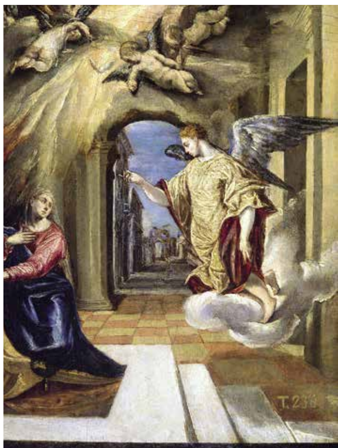
Bebådelsen. Målning av El Greco (1575).