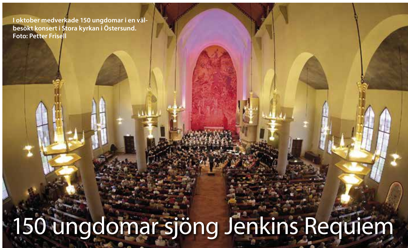
I oktober medverkade 150 ungdomar i en välbesökt konsert i Stora kyrkan i Östersund.