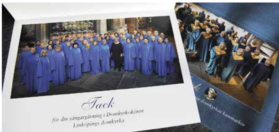
När sångarna slutar i Domkyrkokören i Linköpings domkyrka respektive Linköpings domkyrkas kammarkör får de ett tackkort.

Sara och Marie-Louise betonar att en domkyrkoförsamling har andra förutsättningar än nästan alla andra församlingar.