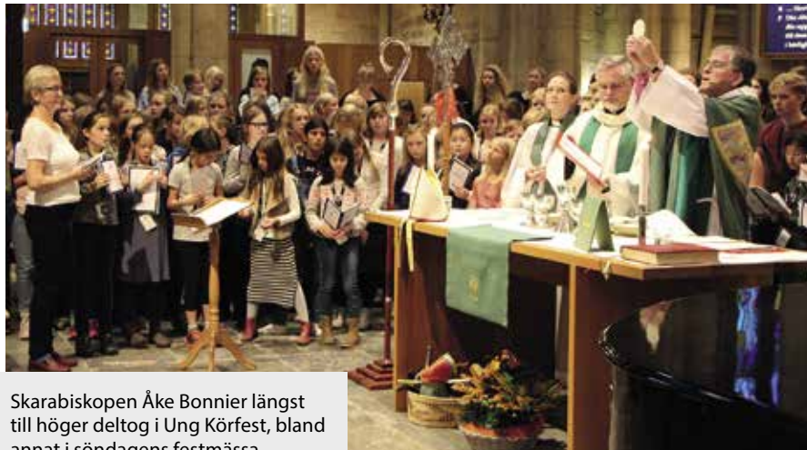
Skarabiskopen Åke Bonnier längst till höger deltog i Ung Körfest, bland annat i söndagens festmessa.