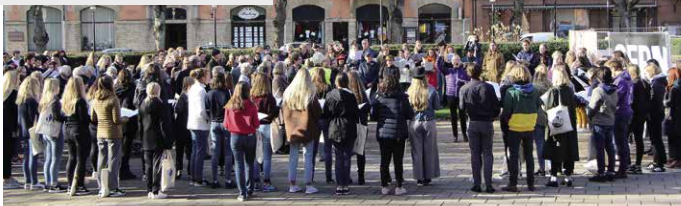
Under helgen hade deltagarna i Ungdomskörfestivalen en minikonsert vid Djäknesenen i Skara.