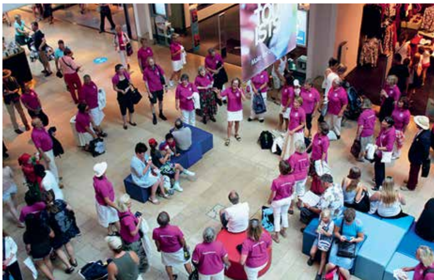
Flashmobs i Gallerian.

Årets tema var 3 x Lindberg så vi sjöng sånger som berörts av en Lindbergs hand i någon generation. Vi sjöng bland annat Gammal fåbodpsalm, Shall I compare thee