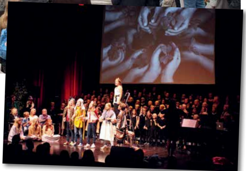
Barn från Högalid, Knivsta, Sollentuna och Uppsala gjorde under kyrkomusiksymposiet musikalen Mot hjärtats mitt av Karin Runow.

Barnkörer stod för ett par av de stora publikdragarna när Svenska kyrkan och Sensus studieförbund arrangerade kyrkomusiksymposium i Uppsala första helgen i september.