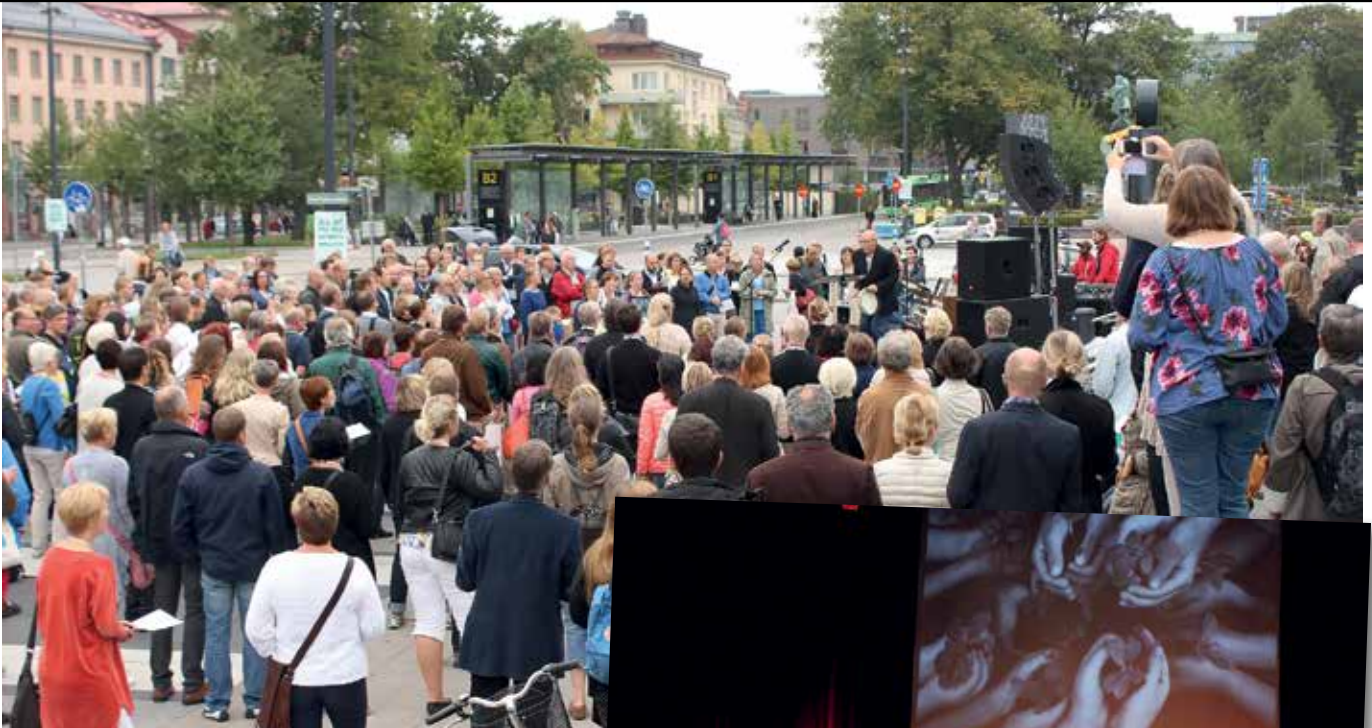
Psalmsång vid Resecentrum.

Vid definitiv eftersändning återsänds försändelsen med nya adressen på framsidan (ej adressidan) till KôrJournalen, Varpvägen 12, 757 57 Uppsala