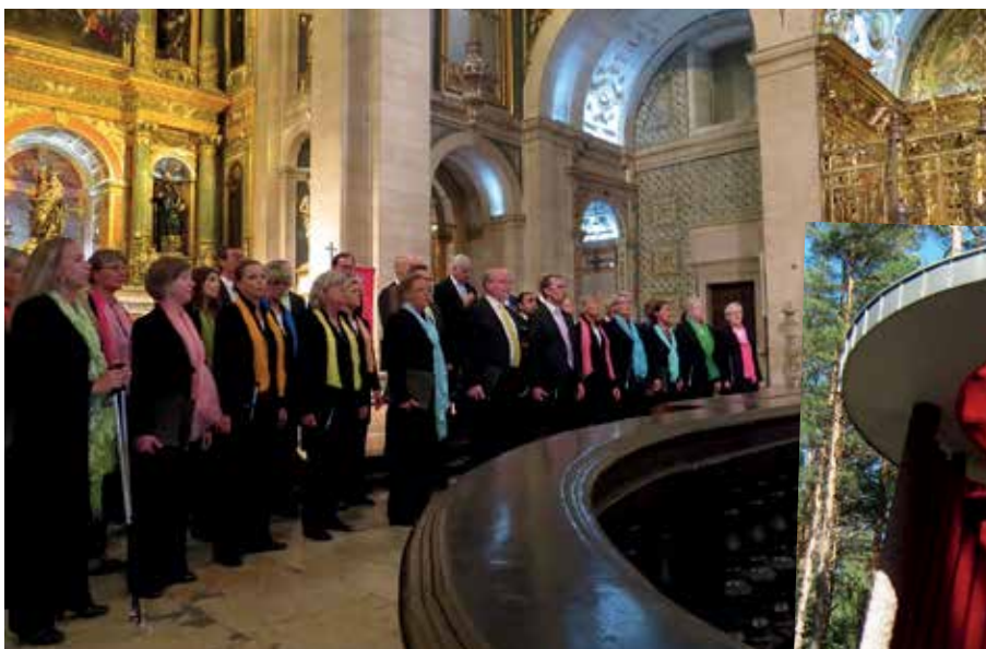
Kyrkokören i Saltsjöbaden ger konsert i praktfulla Sao Roque i Lissabon.