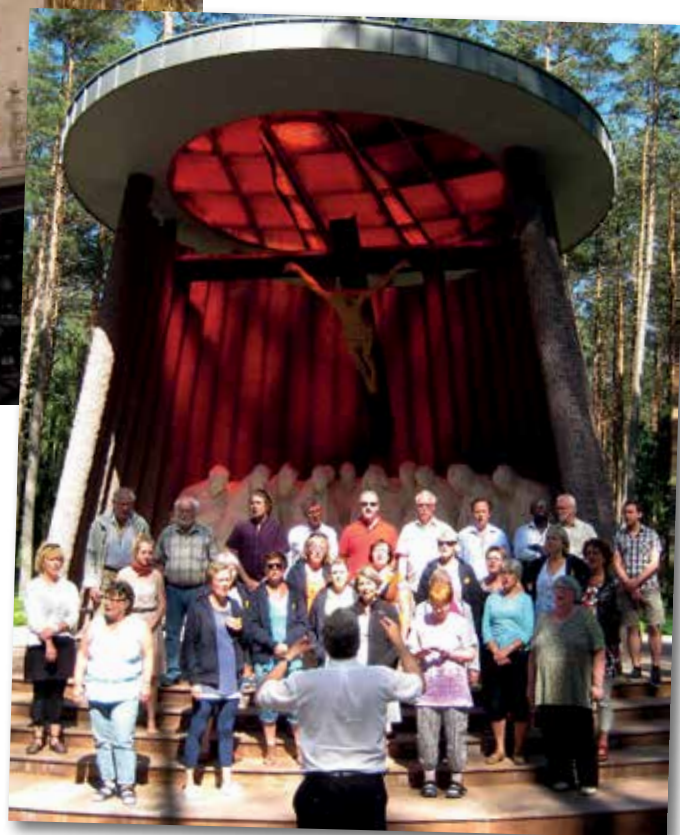
Under Ulrika Eleonora-körens resa till Polen tog guiden med dem till en massavrättningsplats från andra världskriget där tyskarna bragte 381 presumtiva oppositionella om livet.

– Det kändes verkligen kusligt att sjunga där, säger Pär Rosén som också tagit bilden.