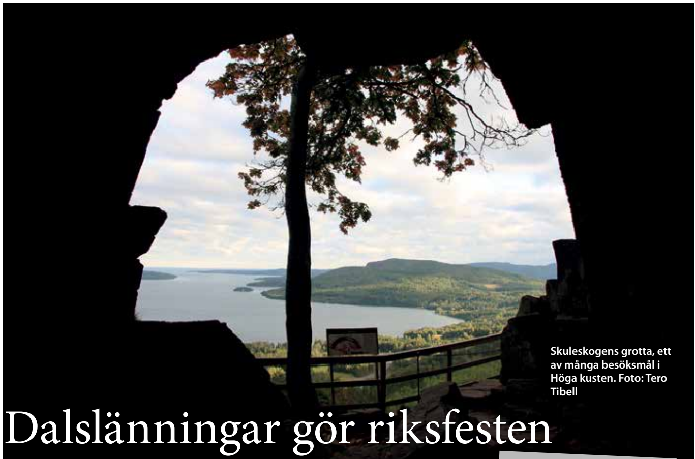
Skuleskogens grotta, ett av många besöksmål i Höga kusten.