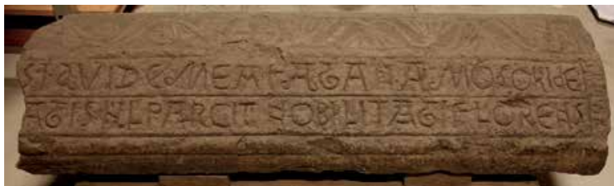
Gravsten från Valtorp i Västergötland, daterad till omkring år 1200. Den finns nu i Historiska museets samlingar, förvarad i magasin. I de två första raderna, som syns på bilden, finns två imperativer: vide (se) och ride (skratta). Hela den vemodiga texten lyder i översättning så här:

I psalm 148 sjungs ”prisa Herren” och ”prisa honom” om och om igen. Detta motsvaras av laudate Dominum och laudate