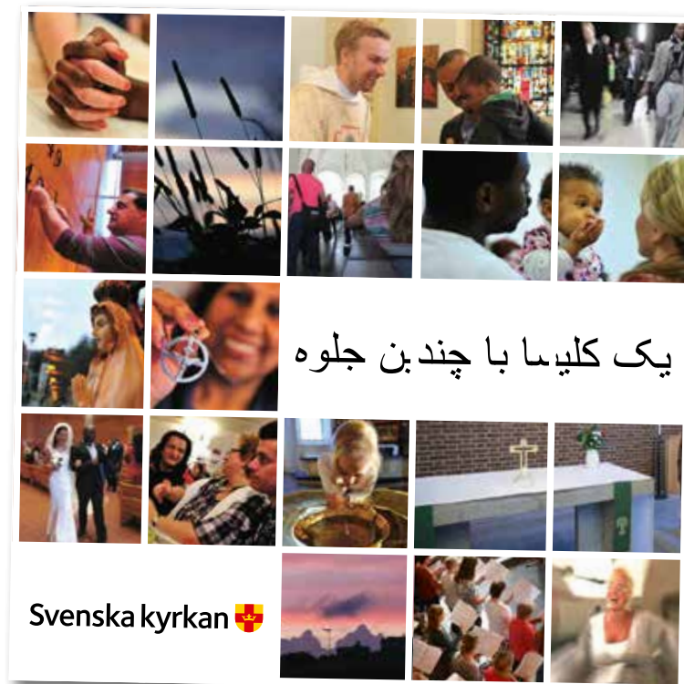
Nätverket Framtiden bor hos oss har översatt ett par foldrar om Svenska kyrkan. Här till farsi.

Fotnot: Mer information om nätverket finns på www.svenskakyrkan.se/framtidenborhossoos (ja, med två oo på slutet).