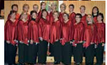
La Chorale, Arnäs församling