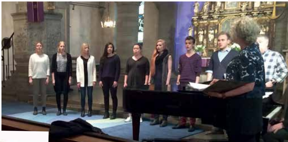
Nästan alla medverkande i musikalen Edens barn bor eller kommer från Örebro.