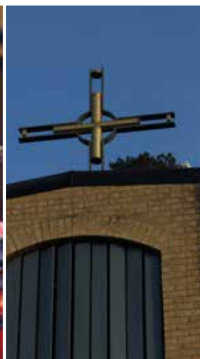
Klocktornet till St Lukas kyrka i Kallhäll.