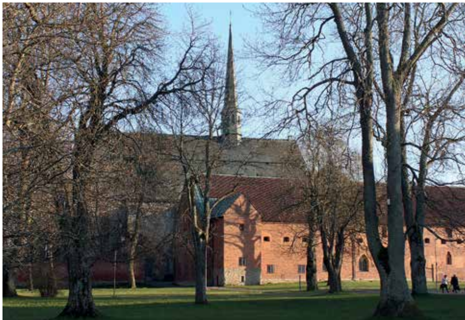
I Klosterkyrkan i Vadstena sjungs det i timmar under det gregorianska dygnet.