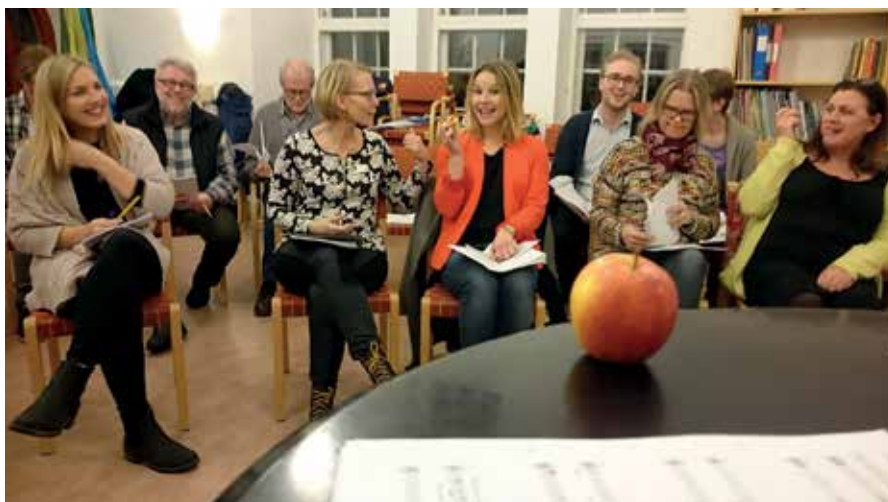
Körövningarna inför musikalen Edens Barn har pågått sedan i januari.